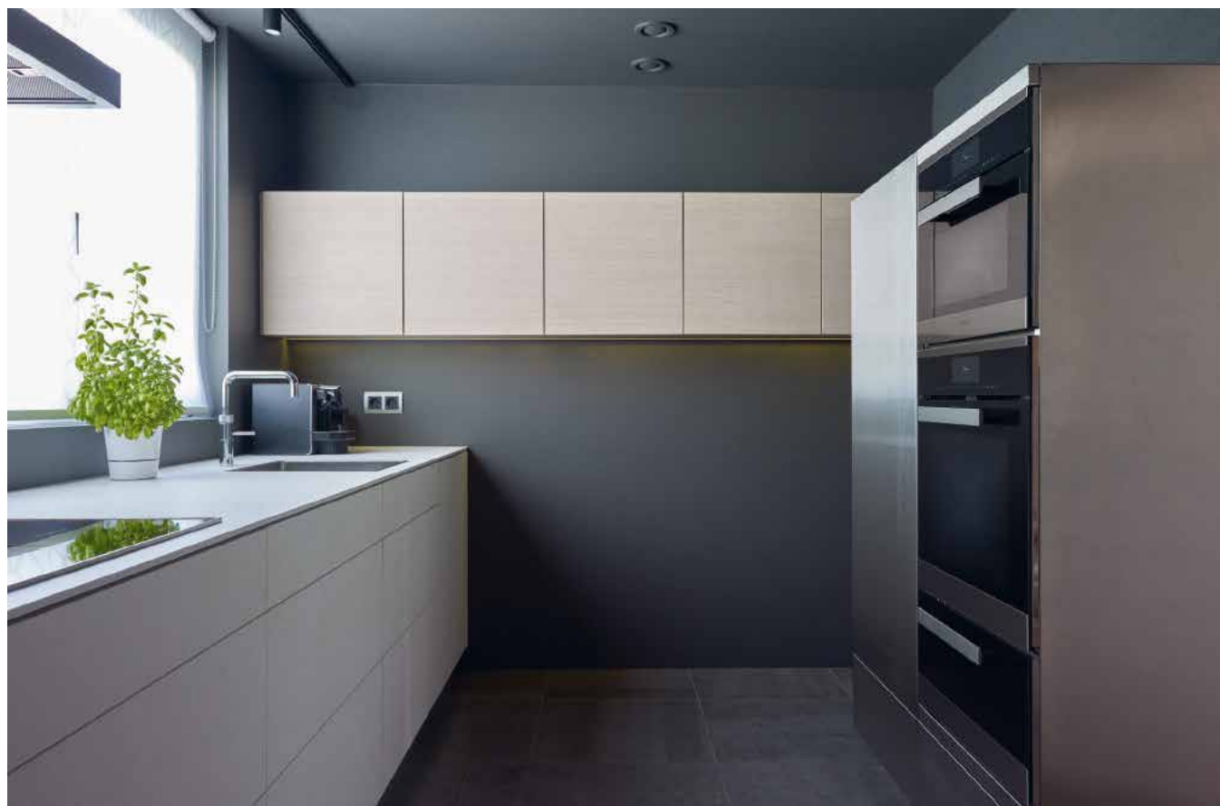
Een donkere keuken met licht werkblad

De keuken van de toekomst evolueert ook, zit vol domotica, slimme afval- en opbergoplossingen, maar oogt simpel en eenvoudig. Wat niet verandert en mogelijk zelfs toeneemt is de hang naar sociale interactie. De centrale eettafel is dan ook een blijvertje.” ■